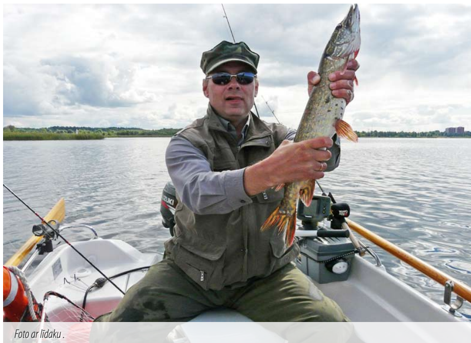
Foto ar lidaku.

Pasaules čempionāts, šajā laikā spinningošanas sezona ir pašā karstumā. Zandarti, lidakas un asari ķeras apmēram vienādās proporcijās. Atsevišķi zobainās plēsoņas eksemplāri sasniedz 5-6 kg svaru. Starp zandartiem visbiežāk trāpījās ap pusmetru gari (aptuveni kilogrami smagi) šīs sugas īpatņi.