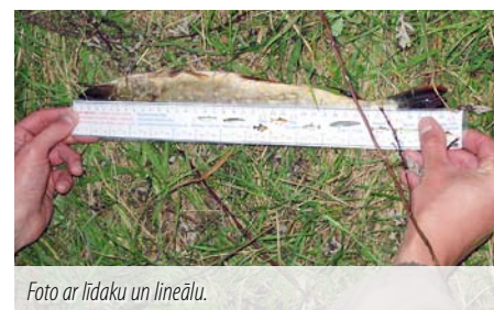
Foto ar līdaku un līnēalu.

salate – no 34 cm, bet zandarts – no 40 cm. Tiesa, Latvijā visu sugu zivju garums tiek noteikts, izmērot attālumu no galvas sākuma līdz astes spuras galam, kamēr Baltkrievijā zivis mēra, neierēķinot asti. Ieviestie ierobežojumi attiecībā uz zivju lielumu būs spēkā arī pasaules čempionātā. Latvijā pastāv ierobežojumi arī attiecībā uz nozvejājamo zivju skaitu. No mūs interesējošajām sugām, kuras ķeras uz spinninga, līdakas un zandartus drīkst ņemt pa 5 katras sugas eksemplāriem. Saldūdens ūdenstilpnēs nav ierobežojumu attiecībā uz asariem – tos drīkst makšķerēt, neņemot vērā izmēru, taču makšķerniekiem-amatieriem nav ļauts