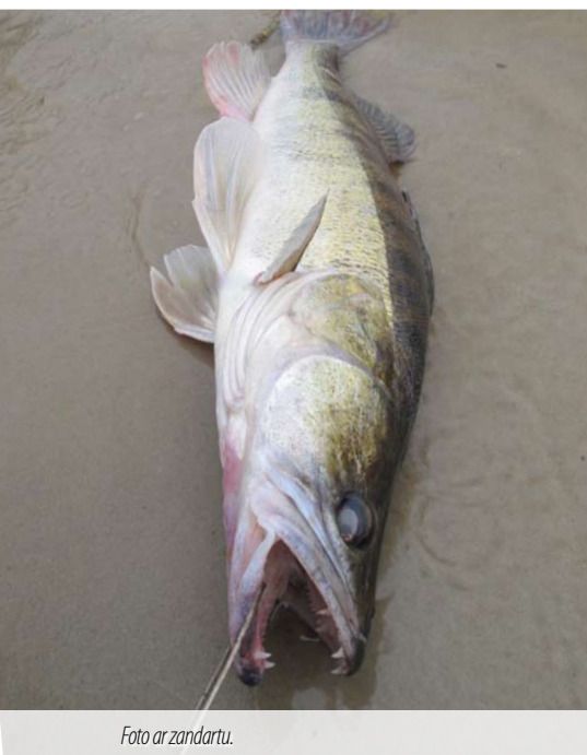
Foto ar zandartu.