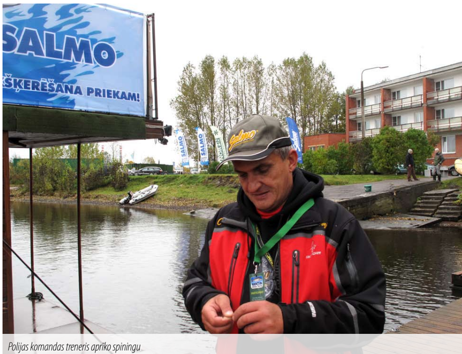
Polijas komandas treneris aprīko spinningu

Carnivorous Artificial Bait Boat Angling