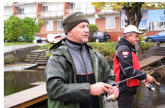
Makšķerešanas sports ir savedis līdzās divas valstis